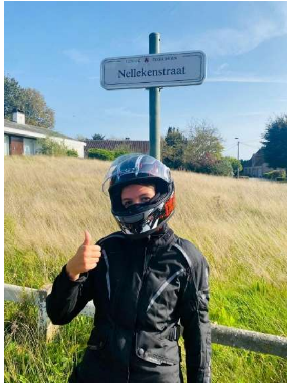
De streek van het Brabants trekpaard en een drank waar Brabant trots op is.